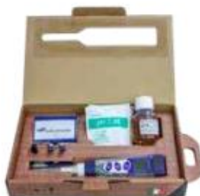
Kit EC2630/COND 5