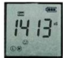
Scherm EC2620/COND 1