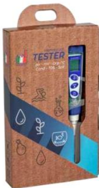
EP2000/PC 5 kit