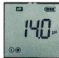
Scherm PH2620/pH 1