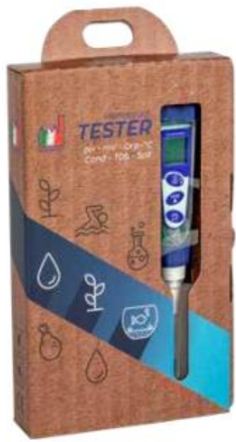
EP2000/PC 5 kit