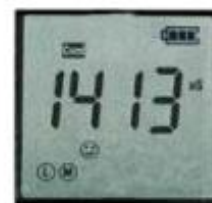
Scherm EC2620/COND 1